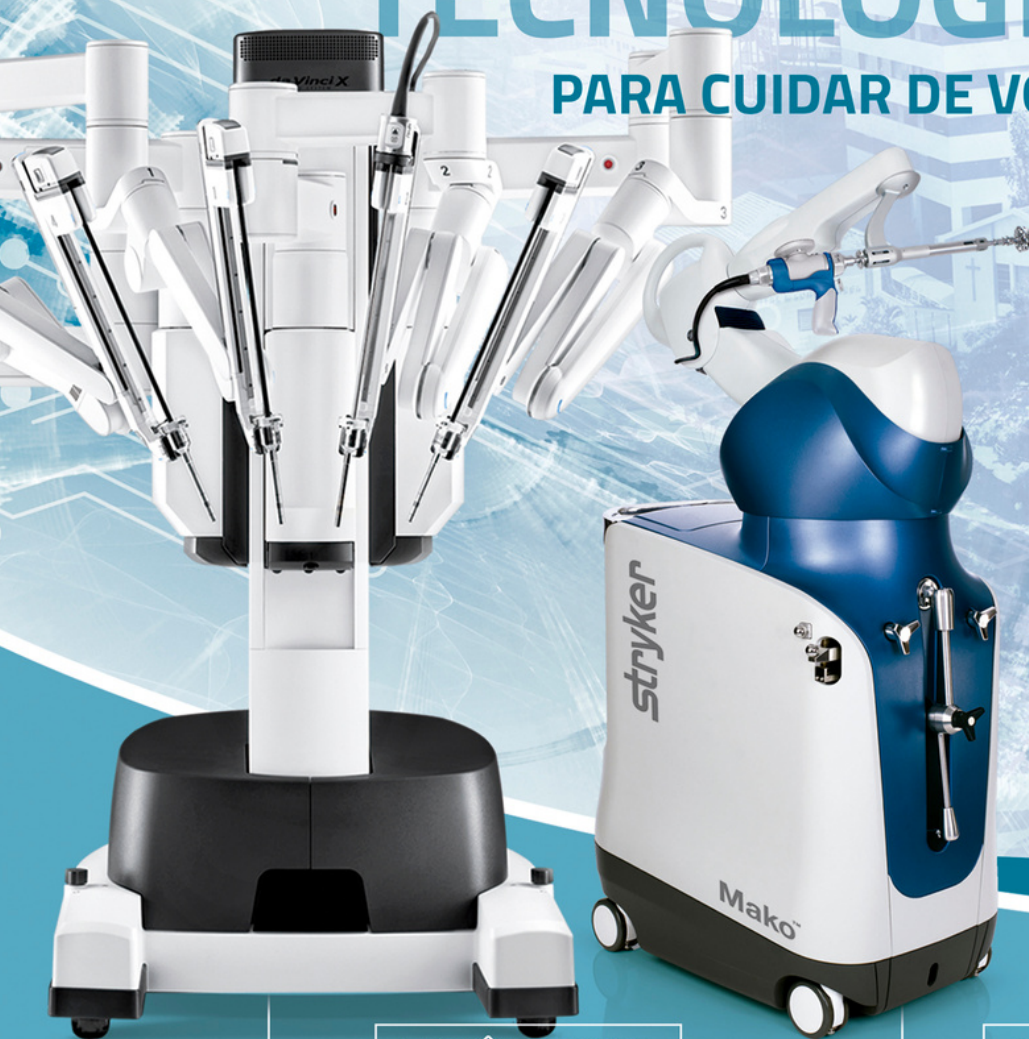
ROBÔ DA VINCI